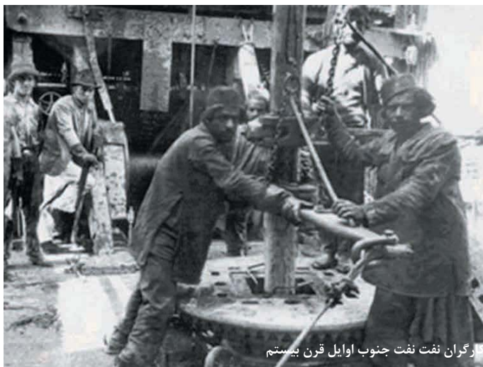
کارگران نفت جنوب اوایل قرن بیستم

ایرانی آذری هسته‌ی مرکزی اعتصاب را تشکیل دادند. در تفلیس شماره‌ی کارگران غیرماهر ایرانی، به پنج تا شش هزار می‌رسید. در صنایع دیگری در مناطق قفقاز و ترکستان شمار کارگران ایرانی حدود سی درصد نیروی کار را در برمی گرفت. کل تعداد کارگران ایرانی شاغل در روسیه پس از مدت نسبتاً کوتاهی به بیش از دویست هزار نفر رسید. کارگران و ایرانیان مقیم روسیه تزاری، همدیگر را «همشهری» می‌نامیدند و بدین گونه هویت خود را در جامعه‌ای بیگانه، پاسداری و بیان می‌کردند.