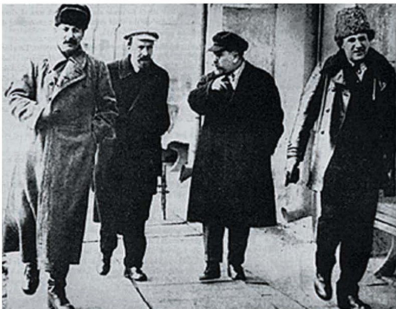
از راست به چپ، زینوویف، کامنف، رایکوف و استالین

یکی از مهم‌ترین اشتباهات حزب کمونیست، غیرقانونی کردن «موقت» و جلوگیری از فعالیت سازمان یافته‌ی گرایش‌ها و جناح‌های درون حزبی بود. ضرورتی که بعدها به‌دست استالین تبدیل به‌فضیلت شد.