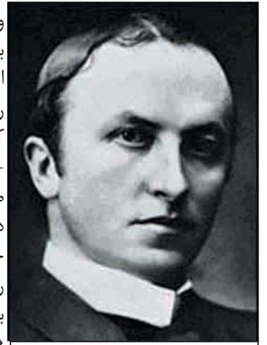
لرد کرزن یکی از مهمترین طراحان سیاست خارجی بریتانیا

و تثبیت رضاشاه، دستگاه بوروکراسی شوروی و کمینترن استالینی نفوذ و موقعیت خود را در ایران در مخاطره دید. کمیته ی اجرایی کمینترن - چند ماه پس از قانون ضدکمونیستی رضاشاه - برای دومین بار پس از ماموریت جاوید، یکی دیگر از اعضای رهبری حزب کمونیست ایران به نام سیفی (عبدالله زاده) را «برای بسیج کمونیست ها و کارگران ایرانی» و «تقویت حزب کمونیست ایران» به