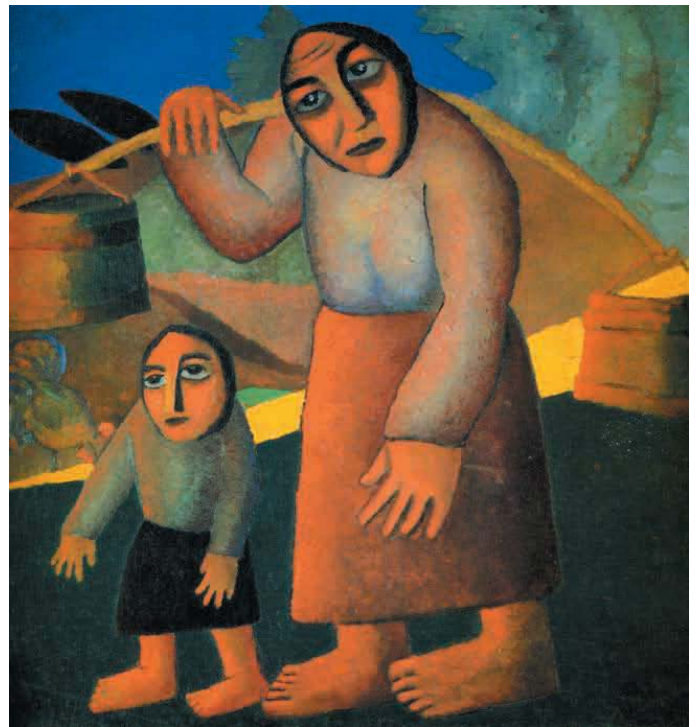
دهقان زن به همراه فرزندش، اثر ماله ویچ، ۱۹۱۲

انگلیسی ها آن را درک کرده بودند. گفتن دارد که «شرایط طبیعی مناسب» فقط امکان و نه واقعیت ایجاد ارزش مازاد را تشکیل می دهد و شرایط حاکم بر جوامع آسیائی موجب می شود که جداکردن تولید کننده ارضی، دهقان از زمین» به سهولت انجام نمی گیرد، چون در این جوامع همان قدر که «ک زنبور می تواند از کندو ببرد» فرد هم می تواند از جماعت اصله بگیرد. ناگفته روشن است که مسائل و مشکلات موجود بر سرراه این جداسازی، به واقع مشکلات فراروئیدن مناسبات سرمایه سالاری در جامعه اند. از دیدگاه مارکس، این جدائی، «اساس کل فرایند انباشت آغازین سرمایه است».