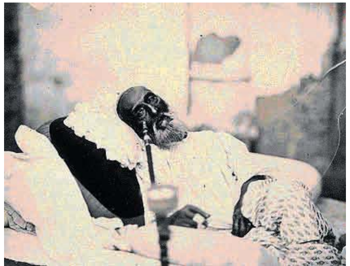
بریتانیا بهادرشاه ظفر آخرین پادشاه تیموری هندوستان را در سال ۱۸۵۸ به تبعید فرستاد

«او [میخائیلوفسکی] اصرار دارد طرح تاریخی من از تکوین سرمایه سالاری در اروپای غربی را به صورت یک تئوری فلسفی - تاریخی از مسیر عمومی تکامل دگرسان کند. مسیر عمومی تکاملی که همه ی جوامع باید تقدیراً و بی توجه به موقعیت های تاریخی خود طی کنند برای این که در نهایت به آن نظام اقتصادی برسند که علاوه بر حداکثر کردن افزایش بازدهی کار اجتماعی باعث توسعه و تکامل کامل بشر هم بشود. اما از جناب ایشان پوزش می طلبم (واقعا افتخار بزرگی نصیب من نموده و در عین حال به من افترای عظیمی روا داشته است) و اما از طرح تاریخی تکامل سرمایه سالاری در اروپا، چه نتایجی می توان گرفت؟ تنها نتیجه ای که «از طرح تاریخی من می توان گرفت» مارکس ادامه می دهد، این که اگر روسیه بخواهد، نه این که حتماً بایستی بخواهد، متعاقب کشورهای سرمایه سالاری اروپای غربی به صورت یک جامعه سرمایه سالاری در بیاید، «این امرامکان پذیر نخواهد بود مگر این که بخش عمده ای از دهقانان به صورت پرولتاریا در بیایند».