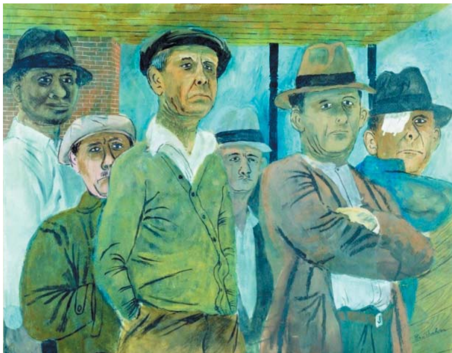
بیکاران، اثر بین شان، ۱۹۳۸

در این میان اصولاً شکل مالکیت ابزار تولید نقش اصلی را در تعیین شیوه تولید بازی می کند. از باب نمونه، نویسندگان جدیدترین کتابی که